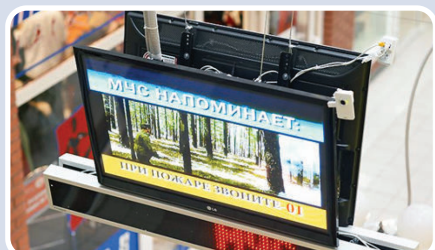
Пункт информирования и оповещения населения в зданиях с массовым пребыванием людей