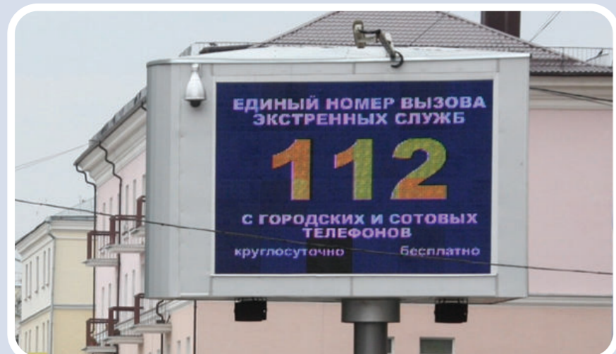
Пункт уличного информирования и оповещения населения