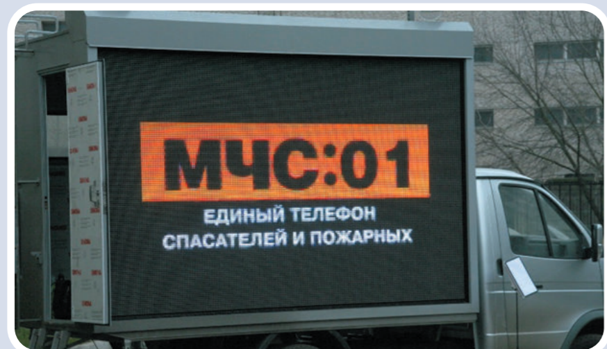
Мобильный комплекс информирования и оповещения населения