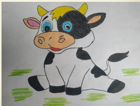
Рисунок Вячеслава Логвинова