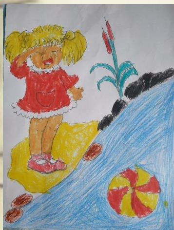
Рисунок Николь Хадоковской