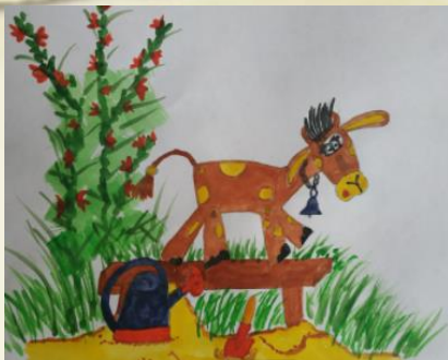
Рисунок Андрея Кудревич