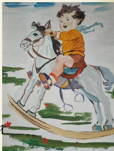
Рисунок Артура Никонович

Самолет Самолет построим сами, Понесемся над лесами, Понесемся над лесами, А потом вернемся к маме.