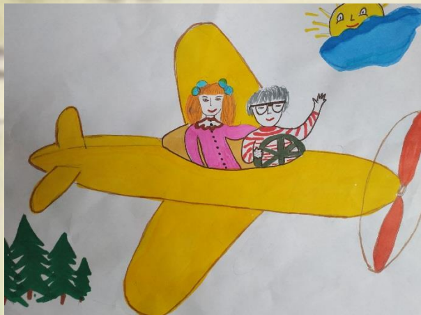
Рисунок Кирилла Князева