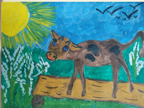
Рисунок Герая Зинабдиева