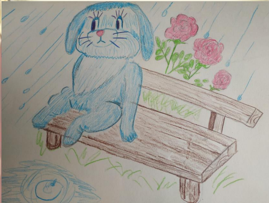
Рисунок Владимира Власова